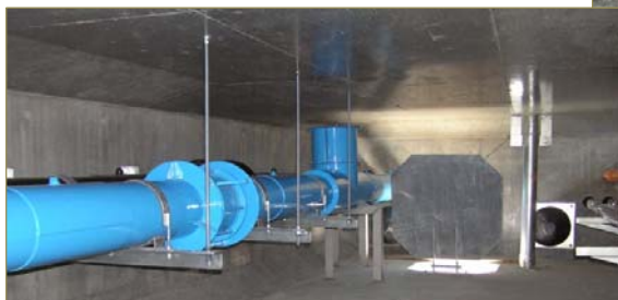
箱桁内部添架状況