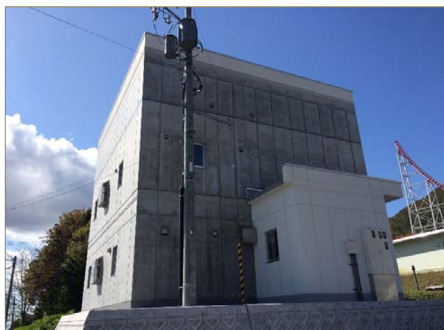
【 浄水場 外観写真 】